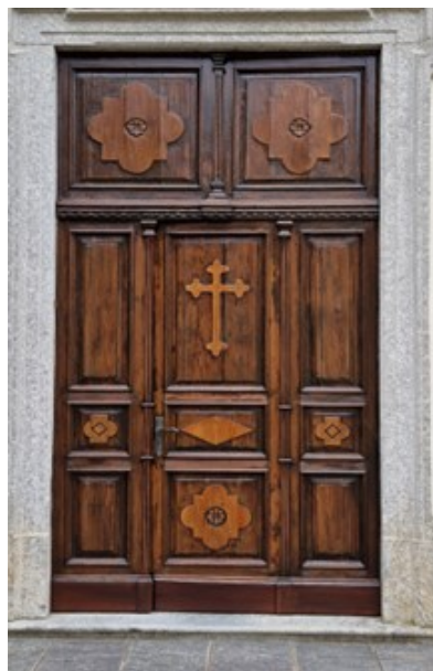
Il portone principale della chiesa di Ponto Valentino, intitolata a San Martino di Tours, riportata agli antichi splendori.

I costi sono stati coperti nella quasi totalità dalla generosità della comunità.