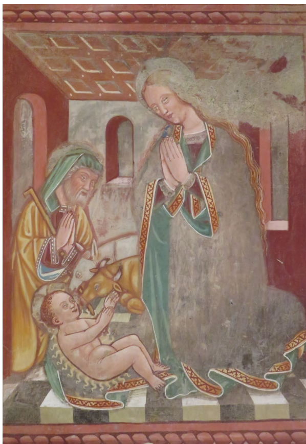
Affresco della Natività nella chiesa di San Carlo in Negrentino.

Ludiano - Malvaglia - Semione Castro - Corzoneso - Dongio - Largario - Leontica Lottigna - Marolta - Ponto Valentino - Prugiasco Aquila - Campo Blenio - Ghirone - Olivone - Torre